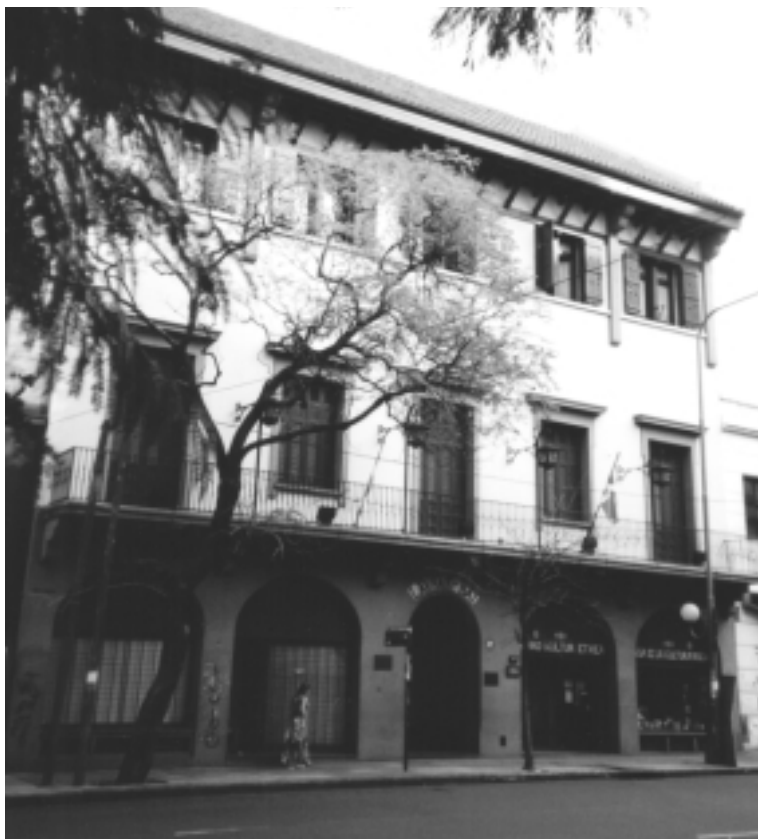
Fachada actual del edificio del Laurak Bat, en la Avenida Belgrano 1144.

Las cifras actuales de asociados, hay que decirlo, no se corresponden con el número de mujeres y hombres de ascendencia vasca que viven en el ámbito geográfico de la ciudad autónoma de Buenos Aires.