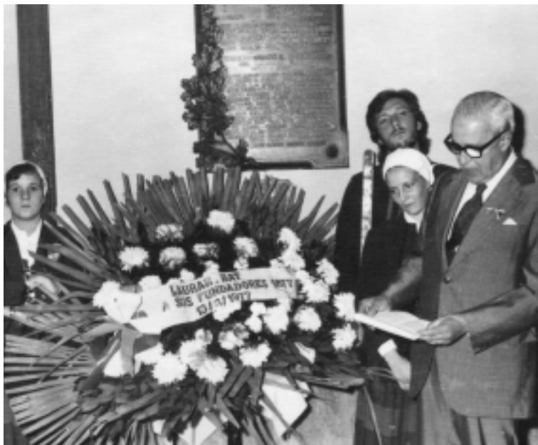
Colocación de ofrenda floral en homenaje a los fundadores, con ocasión del Centenario del Laurak Bat (13 de marzo de 1977).

Quiera Jaungoikoa, nuestro señor, concedernos a todos comprensión y entendimiento, para que este reconocimiento de la autonomía del Pueblo Vasco que hoy festejamos, conduzca por el camino del respeto recíproco de todos los hombres, a la plena libertad de Euskadi, la Patria de los Vascos, objetivo de la fundación de nuestra entidad en tierra argentina 72 .