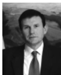
JUAN JOSÉ IBARRETXE MARKUARTU Lehendakaria