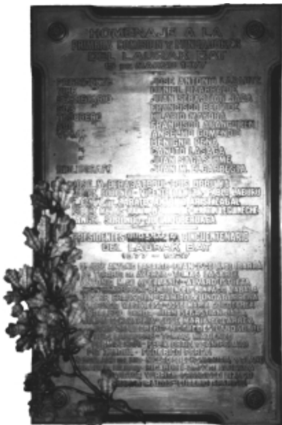
Homenaje a la primera comisión y fundadores del Laurak Bat.