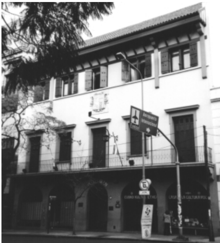
Fachada actual del edificio del Laurak Bat, en la Avenida Belgrano 1144.

de la Comunidad Vasca donde el LAURAK BAT ha hecho acto continuo de presencia, a través de los últimos 50 años.