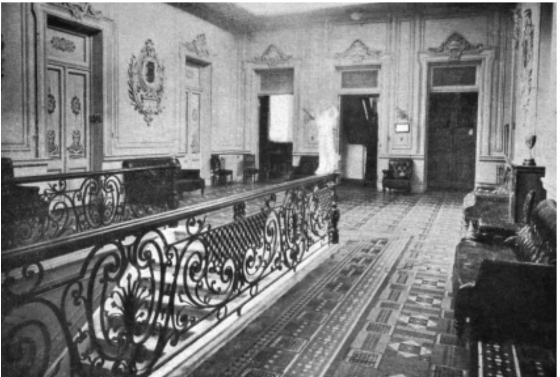
Hall del 1.º piso del edificio. Imagen tomada de una publicación (no se conserva el original).