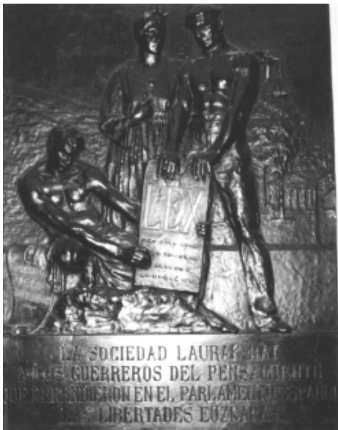
«La sociedad Laurak-Bat a los guerreros del pensamiento que defendieron en el parlamento español las libertades euzkaras».