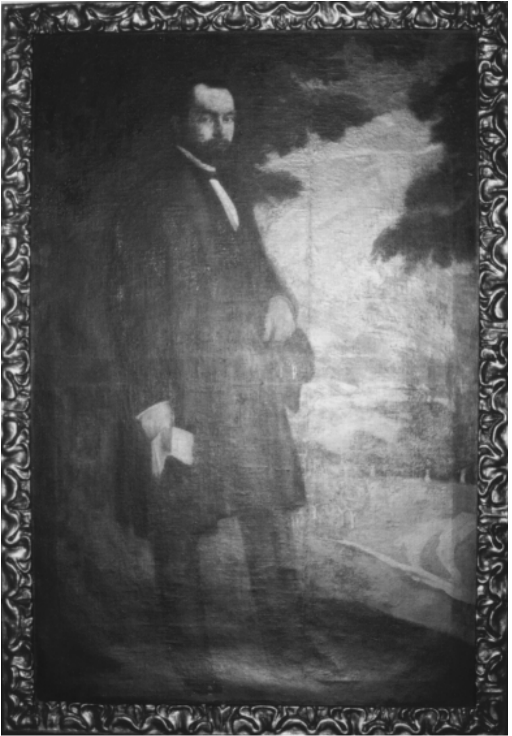
Cuadro de Sabino Arana que preside la sala de reuniones de la Comisión Directiva del Laurak Bat.