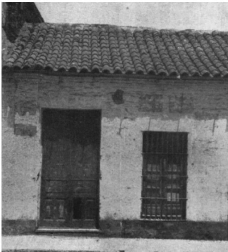
Imagen tomada de una publicación (no se conserva el original).

Fachada del primer edificio (alquilado) del Laurak Bat, ubicado en la calle Potosí 292 (actualmente calle Alsina).