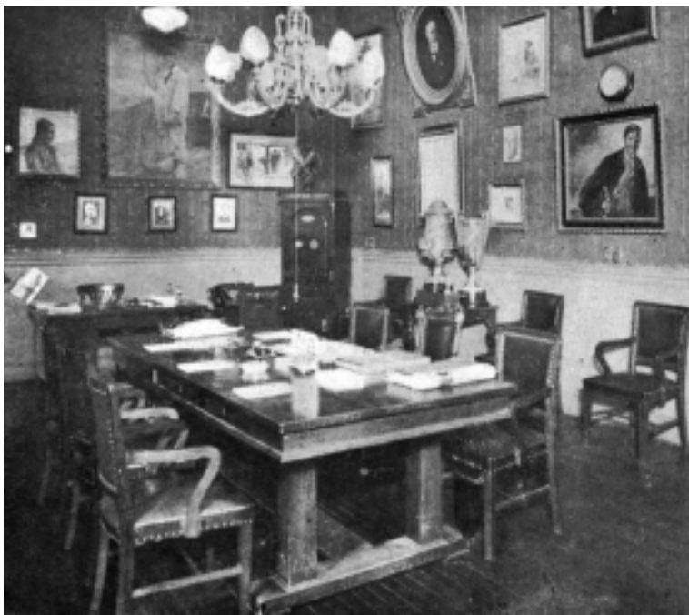
Vista de la Sala de Reunión de la Comisión Directiva. Imagen tomada de una publicación (no se conserva el original).

lema «Jaungoikoa eta Lege Zarra», escrita y financiada por Nemesio de Olariaga y que dirá en todas sus entregas que alcanzarán un total de 246 números durante 20 años consecutivos, desaparece el 15 de noviembre de 1923: «esta publicación no acepta donativos ni suscripciones se reparte gratuitamente y se envía a quien la solicite» 37 .