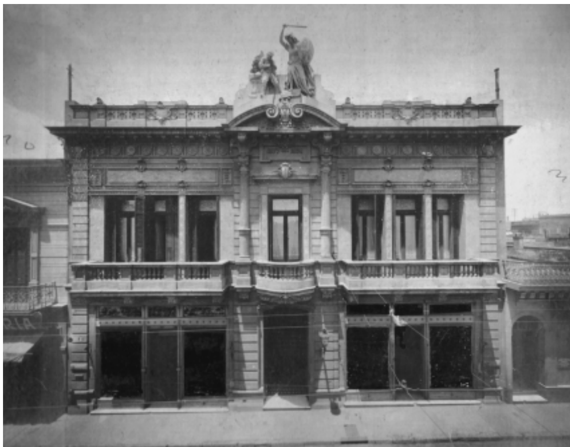
Fachada frontal del edificio del Laurak Bat, inaugurado en 1904. En esta copia de la foto fueron oscurecidos los ventanales de los comercios de la planta baja. En la foto original aparecían las siguientes leyendas: «Maquinarias de lechería» y «Desnatadores ALFA LAVAL» en la vidriera de la izquierda; y «Artículos de Suecia» y «Útiles de queserías» en la vidriera de la derecha.

Con la divisa LAURAK BAT, los vascos de las cuatro provincias sintetizaban la común aspiración por crear un órgano supraprovincial a partir de la colaboración entre sus instituciones, es decir las Diputaciones.