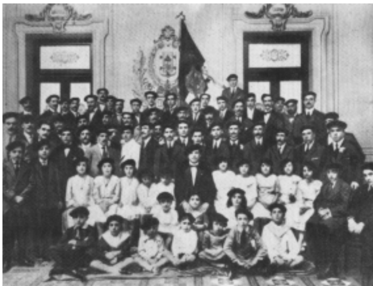
Imagen tomada de una publicación (no se conserva el original).