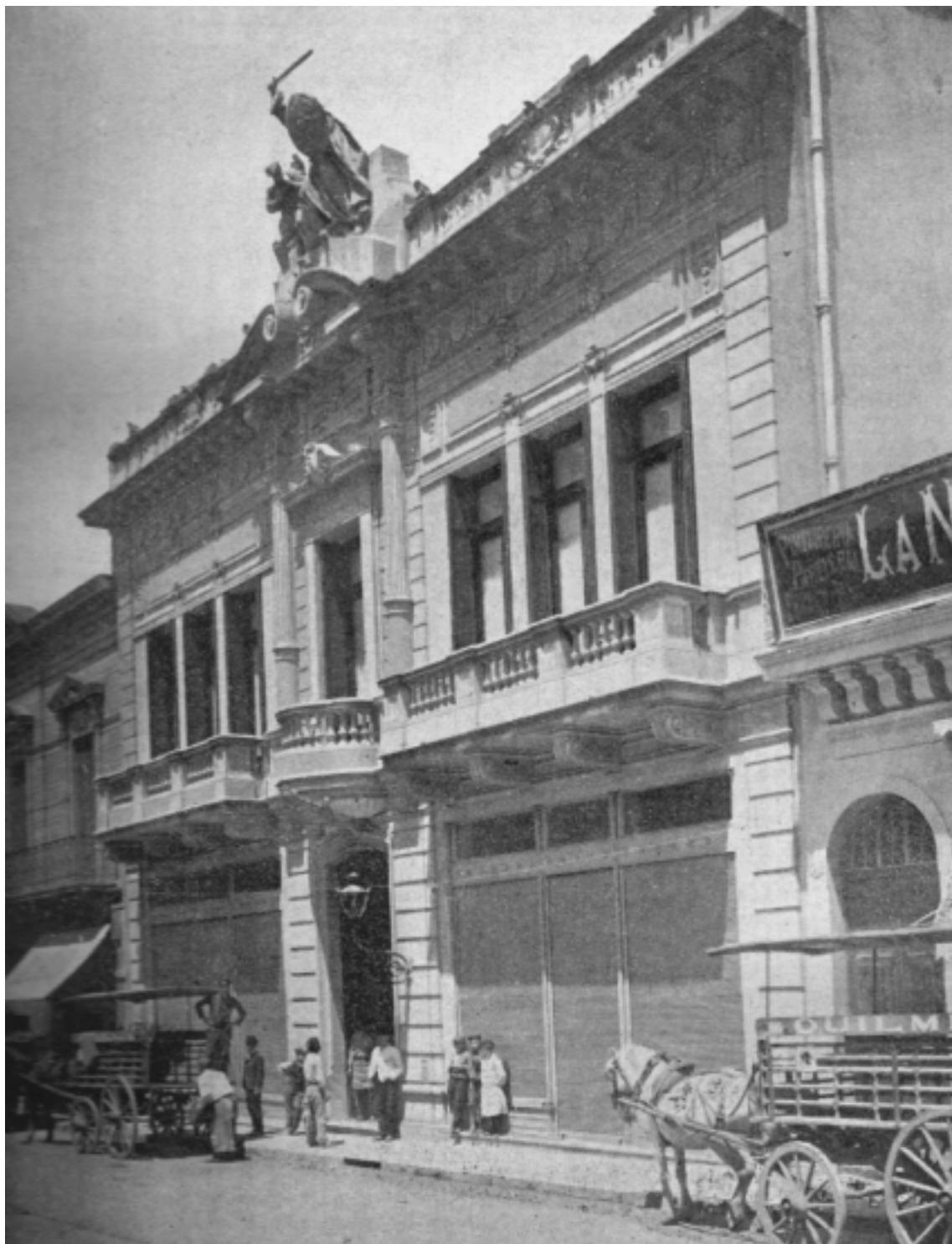
Fachada del edificio del Laurak Bat con carros tirados a caballo en la puerta. Imagen tomada de una publicación (no se conserva el original).