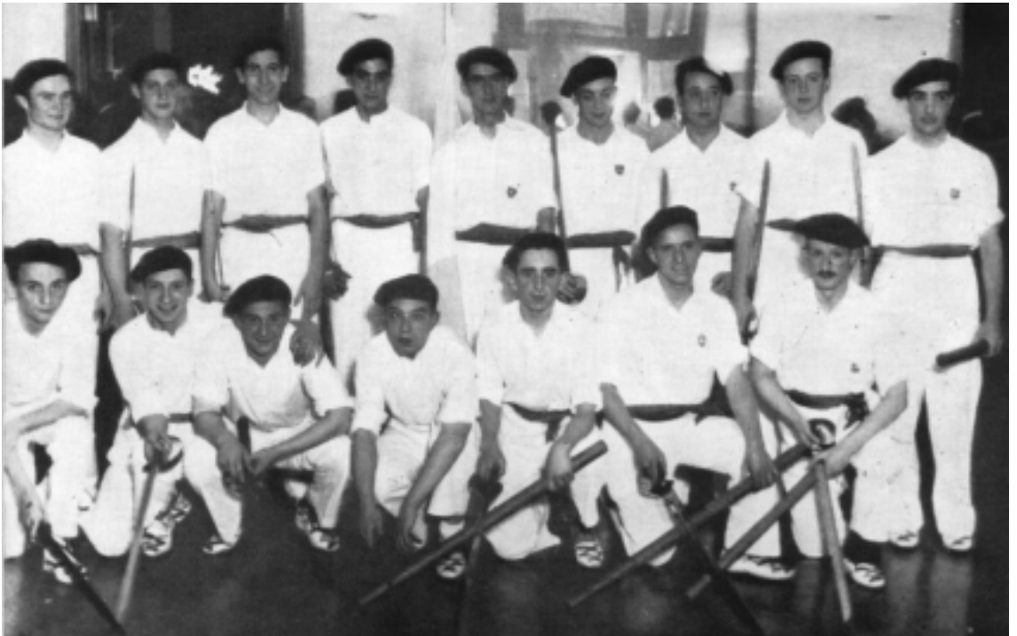
Dantzaris que participaron de los actos de inauguración del nuevo edificio, el 21 de octubre de 1939. Imagen tomada de una publicación (no se conserva el original).

Como ya dijimos, el cambio no sólo fue cuantitativo, producto de la llegada de los exiliados que se asociaban a su arribo o poco después al LAURAK BAT, sino también cualitativo. Así, desde 1939, a la práctica intensiva del juego de pelota y la realización de veladas sociales que habían sido virtualmente las exclusivas actividades en la última década, se sumaron la creación de grupos de danzas, coro, txistularis, clases de euskera, ciclos de conferencias, exposiciones artísticas, etc.