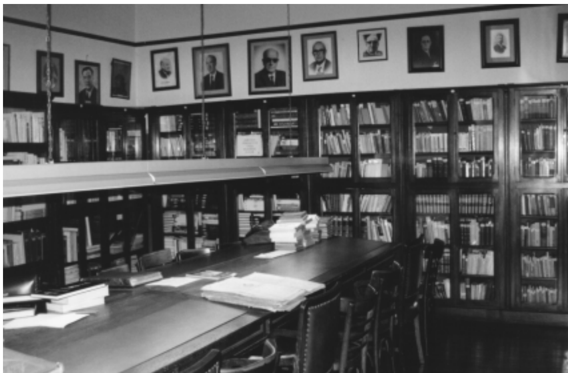
Vista actual de la Biblioteca del Laurak Bat.

Hace 100 años se fundó el Centro LAURAK BAT para conservar el amor al Pueblo Vasco y a sus Fueros, entendiéndolo por Fueros su derecho a gobernarse y dictar sus propias leyes, que les fueran arrebatadas por otra ley del Estado español en 1876.