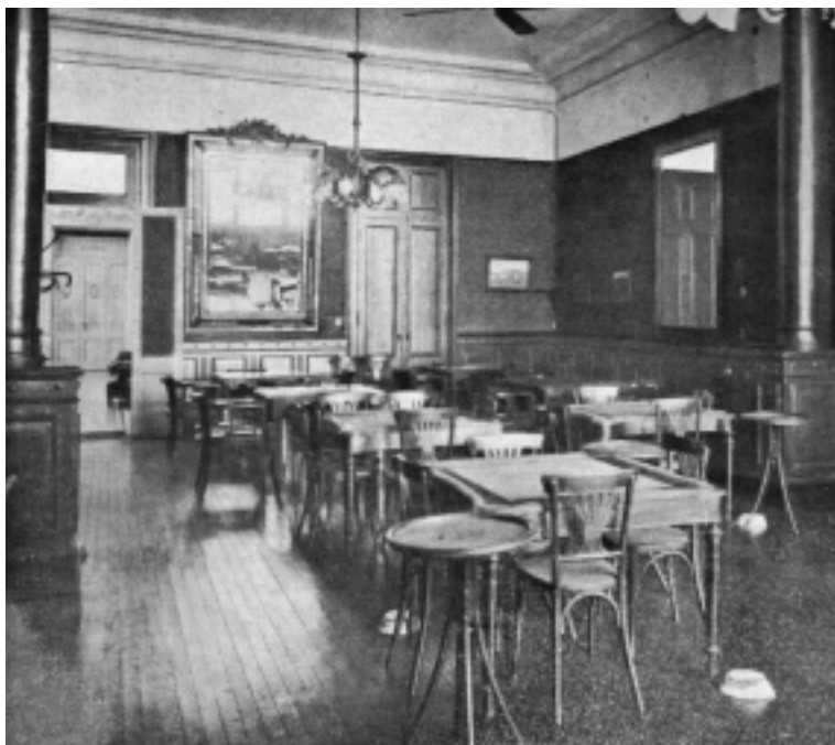
Vista del Salón de Recreo. Imagen tomada de una publicación (no se conserva el original).

En el tiempo que media entre 1898 y 1903 y mientras la hasta entonces mayoría societaria sigue enfrascada en cómo superar la pertinaz crisis económica que aflige a un LAURAK BAT convertido en una sociedad recreativa que apenas puede mantener los loables fines benéficos y solidarios estatutarios, la minoría «culturalista» va a tener la posibilidad de acceder a la conducción de la entidad imprimiéndole un nuevo sesgo, que permita, una vez cortado de raíz el tema económico de la Plaza Euskara, poseer un edificio social propio desde donde realizar una acción cultural vasquista acorde con la importancia de la comunidad vasca residente en la ciudad de Buenos Aires.