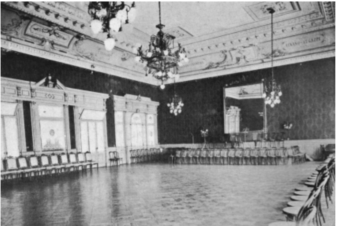
Vista del Salón de Fiestas. Imagen tomada de una publicación (no se conserva el original).